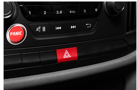
TE MANDA LA UBICACIÓN EN TIEMPO REAL